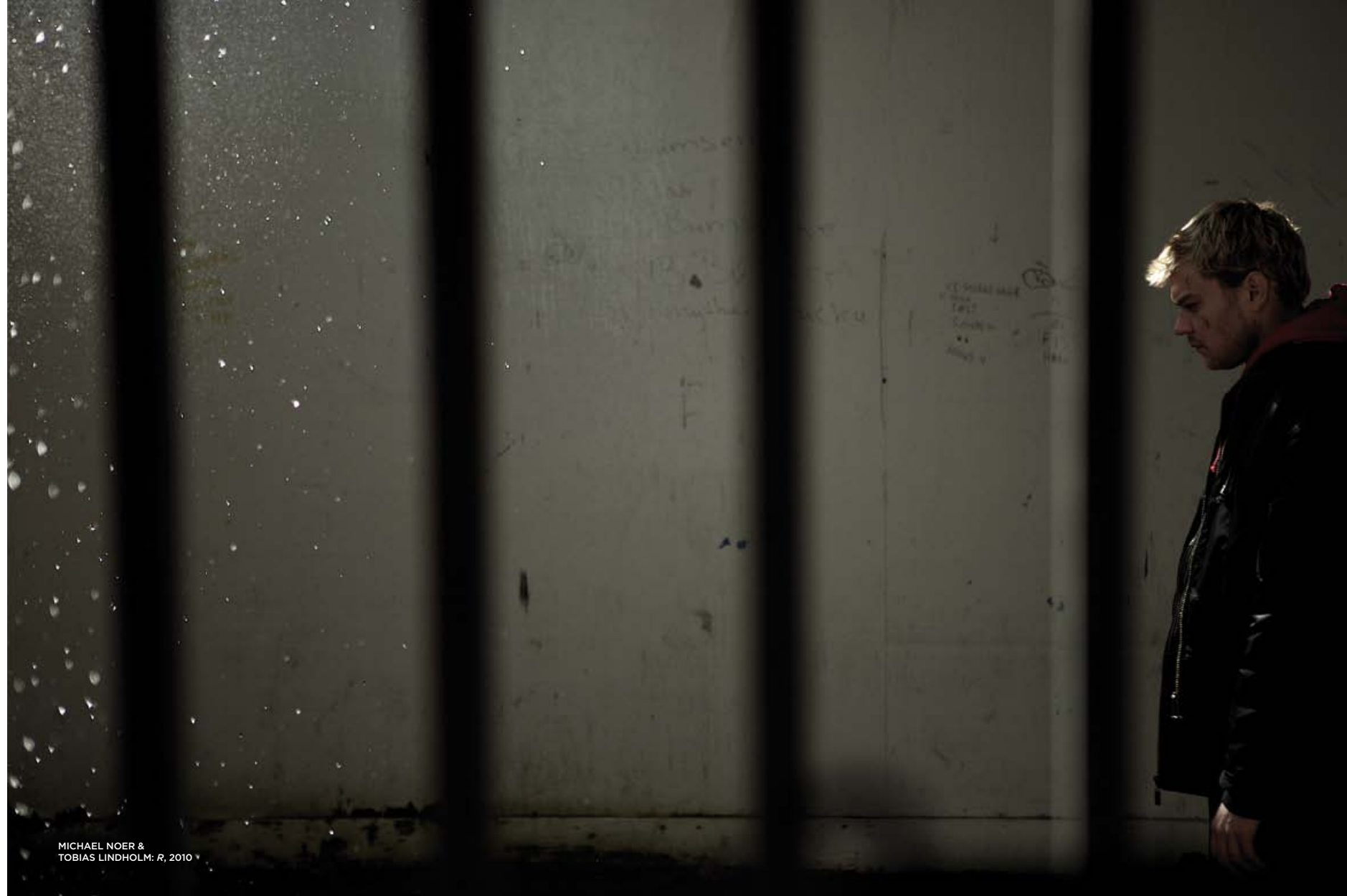
MICHAEL NOER & TOBIAS LINDHOLM: R, 2010

Her kan dokumentaristens værktøjskasse være med til at holde fiktionsfilmene levende – og nærværende. Hvis det er ens ambition, naturligvis.