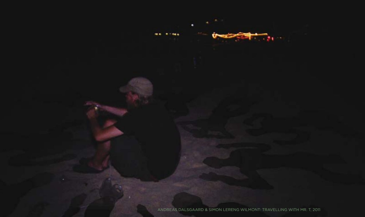
ANDREAS DALSGAARD & SIMON LERENG WILMONT: TRAVELLING WITH MR. T, 2011