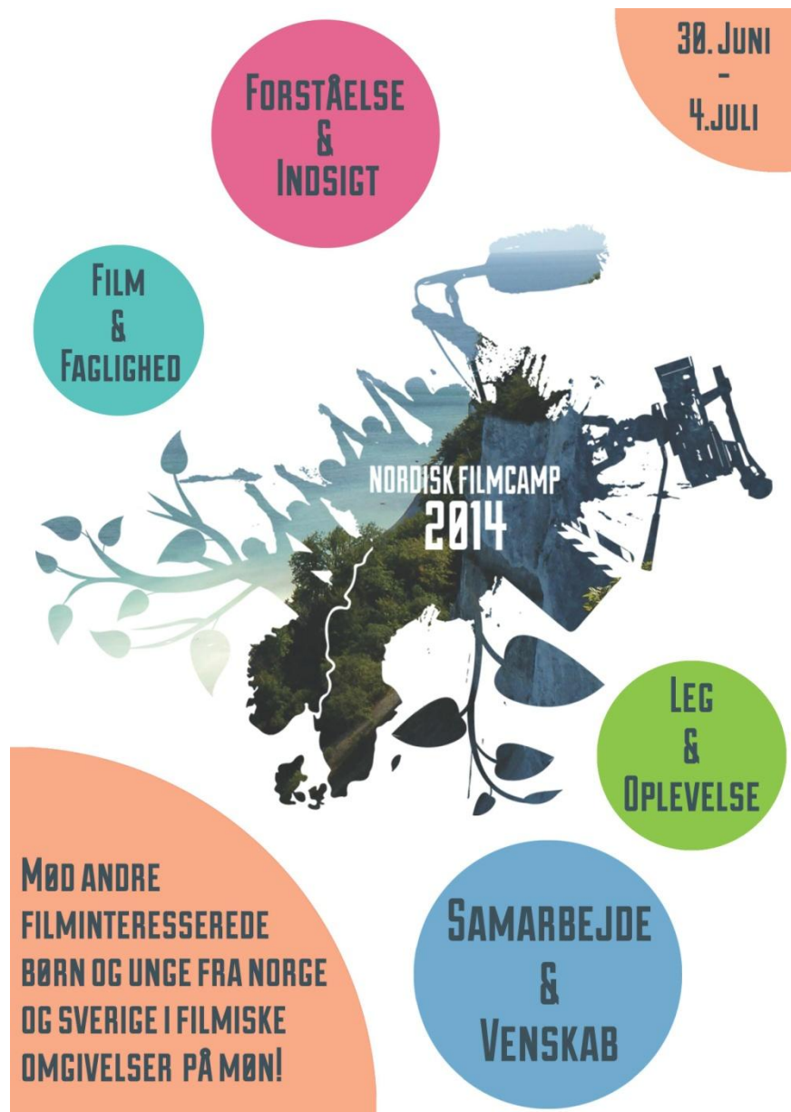
(Forside fra original invitation)